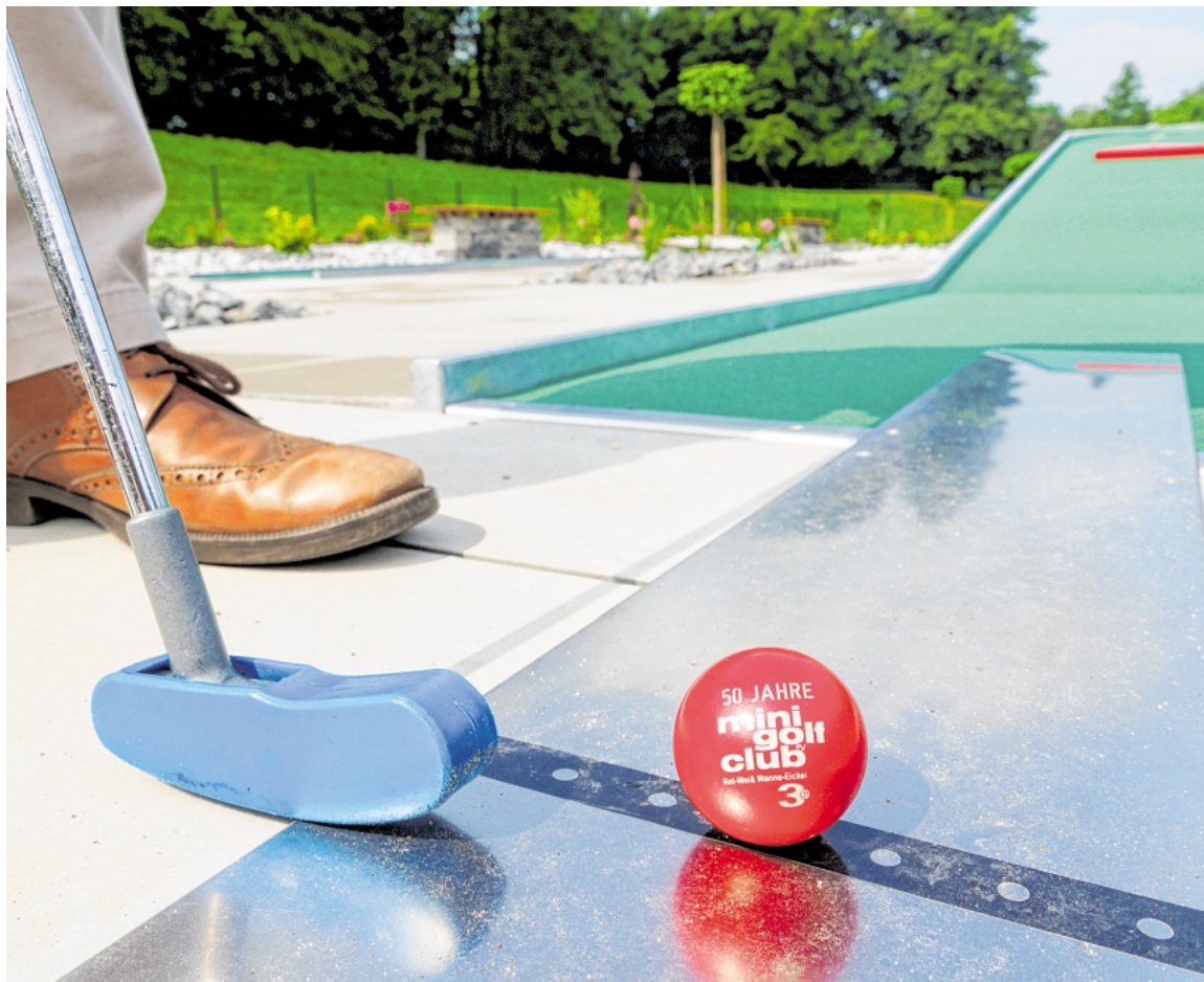
Der Abschlag erfolgt von einer Edelmetallrampe. Die Position des Balles ist frei wählbar.

Als „eingeborener“ Wanne-Eickeler, der schon als Kind auf den benachbarten Betonbahnen gespielt hat, fällt mir sofort auf: Der Abschlag des Balles erfolgt nicht auf der Bahn selbst, sondern auf einer Edelmetallschiene, ich kann aus mehreren Positionen wählen. Eine der Bahnen hat einen sprichwörtlich erhöhten Schwierigkeitsgrad. Das Loch ist auf einem Hügel in der Mitte. Verfehle ich, rollt der Ball auf mich zurück oder auf die andere Seite. Da ich in den vergangenen Jahren höchst selten gespielt habe, ist es mit der Präzision meiner Schläge nicht weit her. Aber vielleicht liegt es ja auch am Material. Ich schwinde mit dem herkömmlichen Leihschläger. Zum Vergleich kann ich bei dieser Gelegenheit auch einen Profischläger und einen Koffer voll mit Bällen verschiedener Härtegrade ausprobieren. Der Unterschied ist deutlich spürbar. Mit dem Profischläger wird der Ball spürbar schneller als