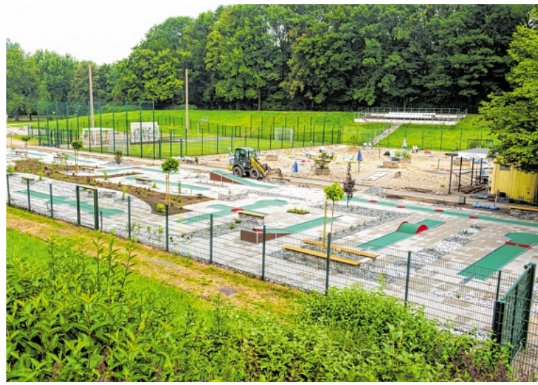
Die neue Minigolfbahn im Funpark Eickel. Im Hintergrund ist die Anlage mit Anlagen mit den Eternitbahnen zu sehen.