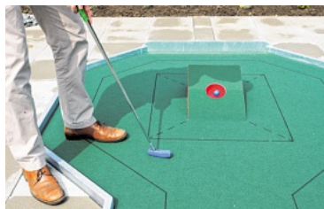
Zum Spielen der Bälle kann man die Bahnen betreten.