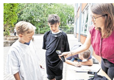
Nach dem Laufen wurde die Temperatur unter den T-Shirt gemessen.

bleiben: Die Kinder konnten laut Stadt ein weißes oder ein schwarzes T-Shirt wählen und mussten damit über den Schulhof rennen. Danach sei die Temperatur auf dem Bauch gemessen worden. Dabei habe sich gezeigt, dass das schwarze Kleidungsstück bis zu zehn Grad wärmer gewesen sei als das weiße. Am Ende seien alle Schüler zu „Klimaxperten“ ernannt worden.